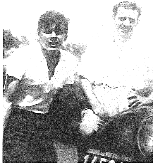
1. Ernesto & Alberto

El libro “Diarios de Motocicleta” es un relato hecho por Ernesto Guevara, conocido como el ‘Che’ por ser de origen argentino, y en el que comenta sobre el viaje que hizo por Sudamérica cuando era joven, con su muy buen amigo Alberto Granado, que lo convirtió en el hombre famoso que es reconocido hoy por todo el mundo. Muchas experiencias y descubrimientos que tuvo en el camino le llevó a entender los